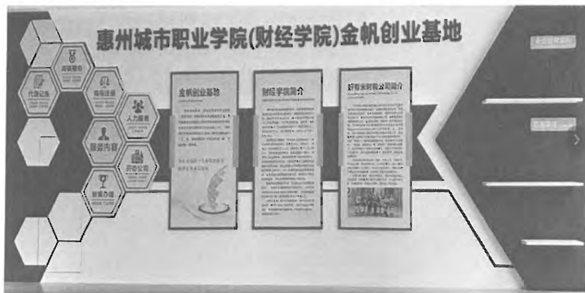
图 15：校内金帆创业实习基地