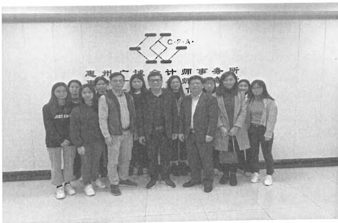
图 17：校外实习基地现场