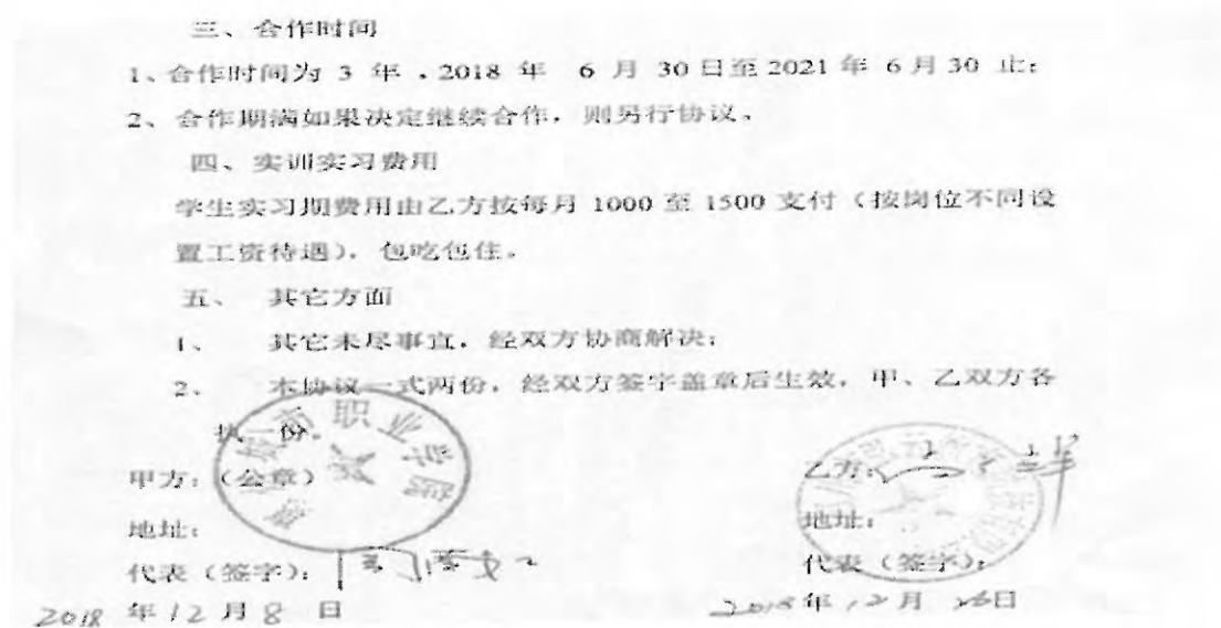
图 16：校外实训实习基地合作协议书