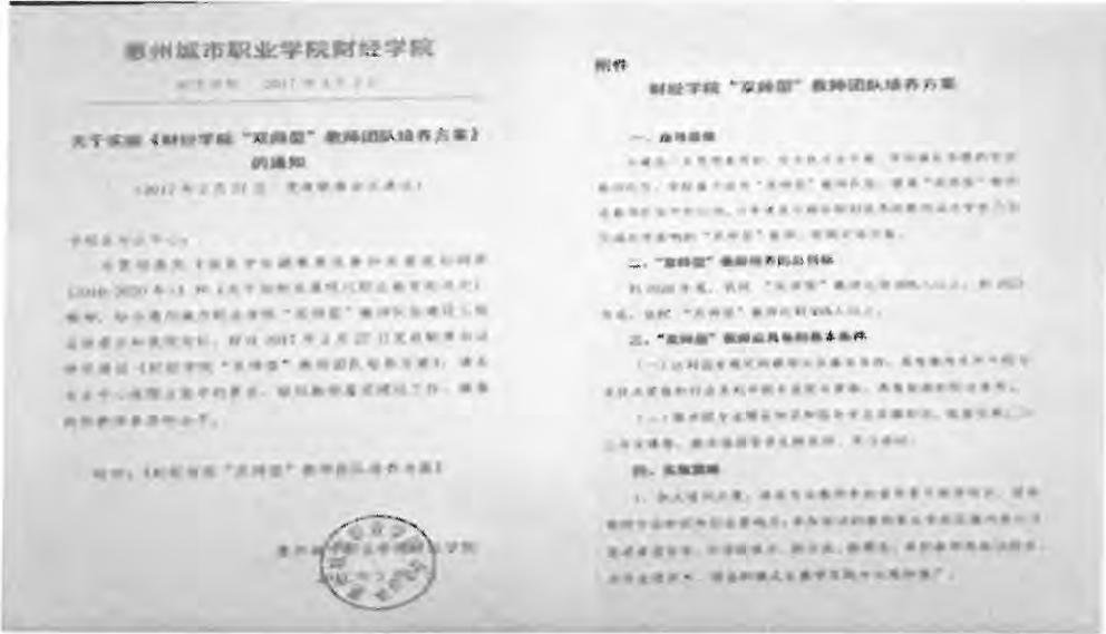
图 10：财经学院双师型教师团队培养方案部分截图