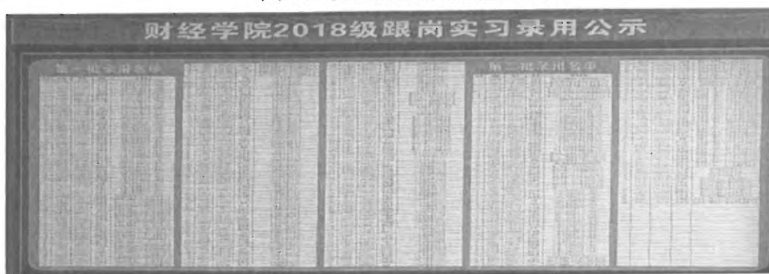
图 8：校外实践基地录用学生情况