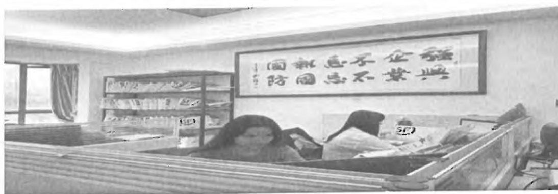
图 9：校外实践基地实习