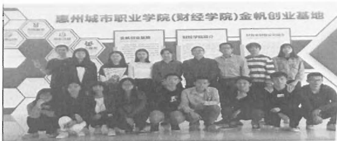
图 7：校内金帆创业基地实习